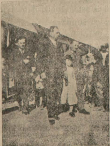
B. M., Meclisi Reisi Kâzım Paşa Hz.

Ankara, 18 [Hususî] — B. millet meclisi reisi Kâzım Paşa Hazretleri buraya geldiler. meclisin açılma gününün yaklaşması dolayısıyla hazırlıklar görülmekte ve Vekâletlerde meclise sevk edilecek kanun lâyiha-larını hazırlayan komisyonlar sık sık toplantılar yapmaktadırlar. Haber verildiğine göre meclisin bu toplantısının ilk günlerinde mühim kanunlar müzakere edilecektir.